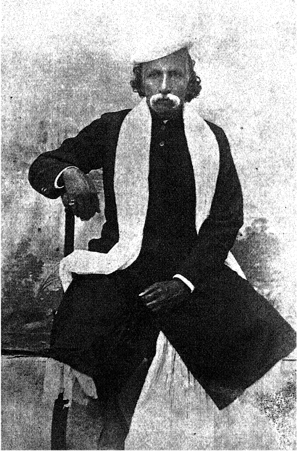
साहित्य-महारथी प्रेमचन जी (६० वर्ष)